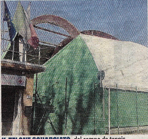
IL TELONE SQUARCIATO del campo da tennis

VAREDO (peo) Un'altra giornata di forte vento e il telone si è completamente squarciato.