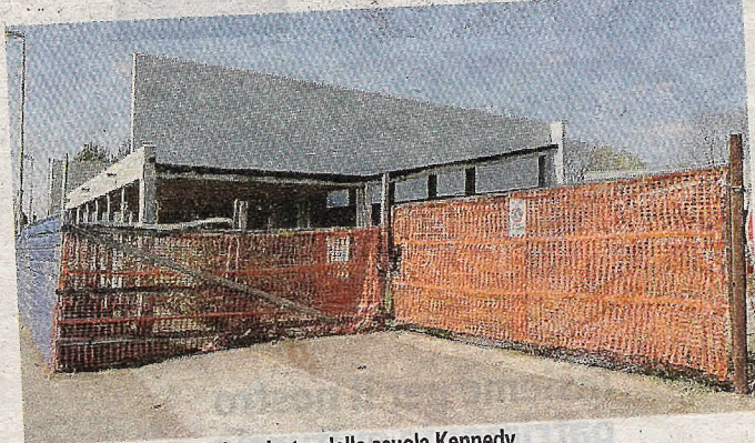
I LAVORI FERMI della palestra della scuola Kennedy

arenato da anni al primo lotto. Il progetto esecutivo definitivo dell'intervento di completamento è del settem-